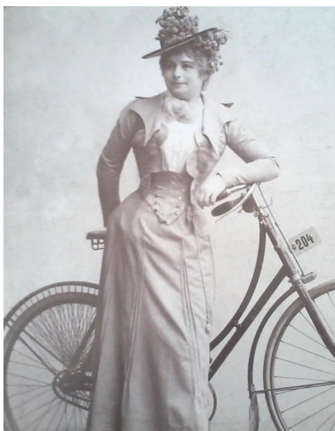
Ábrányiné Wein Margit